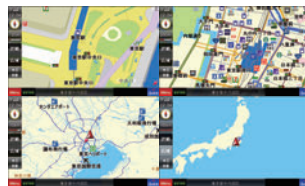
10m~100kmまで14段階切り替え可能