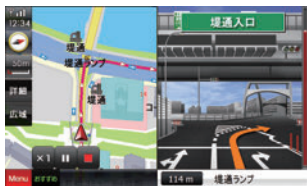
見やすい立体表示で高速入口もスムーズ