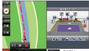
SA・PAの詳細情報が表示されます。