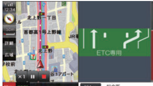
ETCレーン看板表示で、高速道路への進入がよりスムーズに！