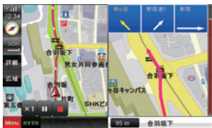
分かりやすい詳細案内で交差点もパッチリ