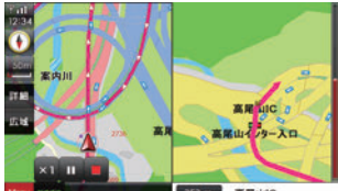
圏央道、阪神高速など、2014年6月までに開通した道路を収録。新しい道路を走ろう！