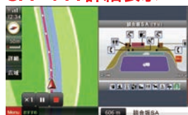
※すべてデモ走行画面です。