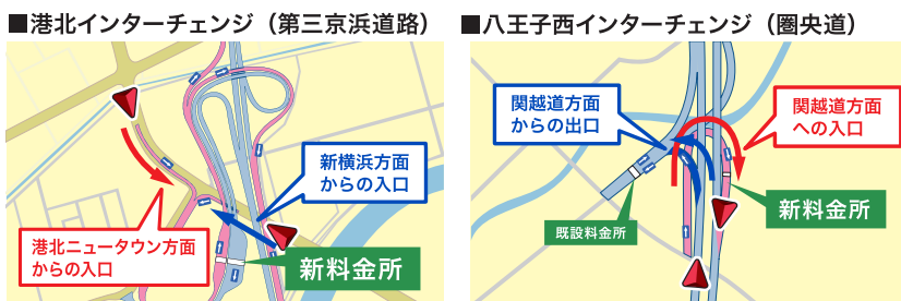
(※画像はイメージです。)