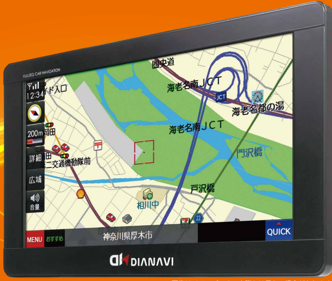
※画像はイメージです。実際とは異なる場合があります。