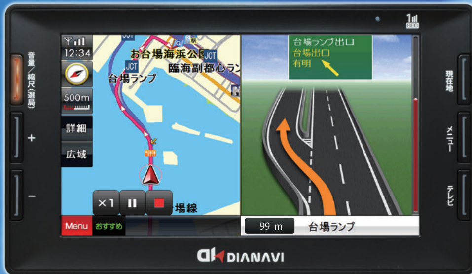
※画面はハメコミ合成で、実際とは異なる場合があります。