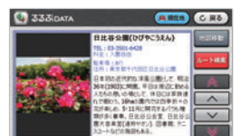
るるぶDATAの詳細情報もその場でチェック!!