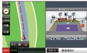
SA・PAの詳細情報が表示されます。