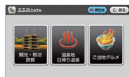
エンプレイスのオリジナルコンテンツから目的の場所を検索しよう!!