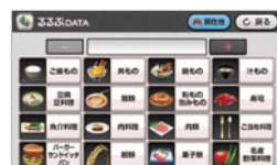
都道府県のご当地グルメを直接検索できて、旅先でも大活躍