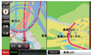
圏央道、阪神高速など、2014年6月までに開通した道路を収録。新しい道路を走ろう！