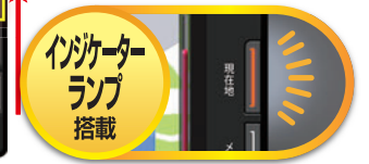
※画面はハメコミ合成で、実際とは異なる場合があります。