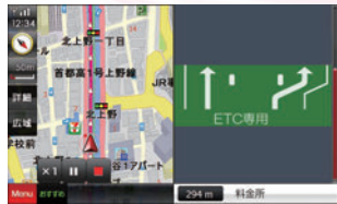
ETCレーン看板表示で、高速道路への進入がよりスムーズに！