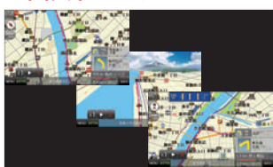
ヘディングアップ・パードビュー・ノースアップ の切り替えが可能