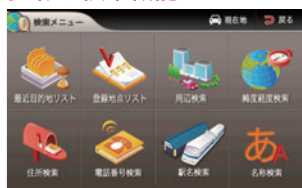
さまざまな検索方法で目的地を検索 大きなアイコンで操作もラクラク