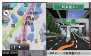
見やすい立体表示で高速入口もスムーズ