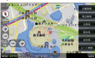
位置登録や周辺検索などをQUICKに 呼び出し可能