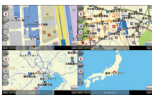
10m~100kmまで14段階切り替え可能