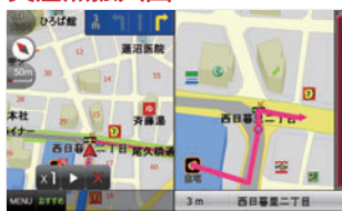
分かりやすくなったルート案内で 交差点もバッチリ